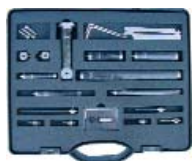
ThermoFit Starter-Baukasten mit Tastern und Zubehör 25- teilig, Best.-Nr. 626107-9011-000