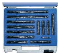
ThermoFit Verl. -Baukasten Ø 20 mm 14-teilig, Best.-Nr.000000-1109-045