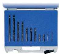
ThermoFit Verl. -Baukasten Ø 11 mm 11-teilig, Best.-Nr.000000-1109-048

ThermoFit® ist ein Markenzeichen von Carl Zeiss IMT GmbH.