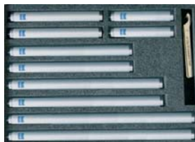
ThermoFit SILBER Verl.-Baukasten Ø 20 mm 14-teilig, Best.-Nr. 626107-9012-100